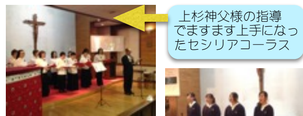
上杉神父様の指導です。ますます上手になったセシリアコーラス