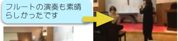
フルートの演奏も素晴らしいかったです